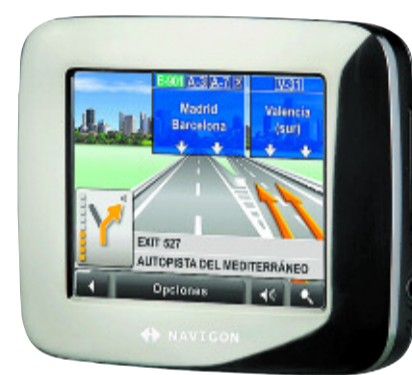
Todos los caminos. Navegador 5110, de Navigon, con visión real de la carretera y mapas de toda Europa. 349 euros. De El Corte Inglés. www.elcorteingles.com .