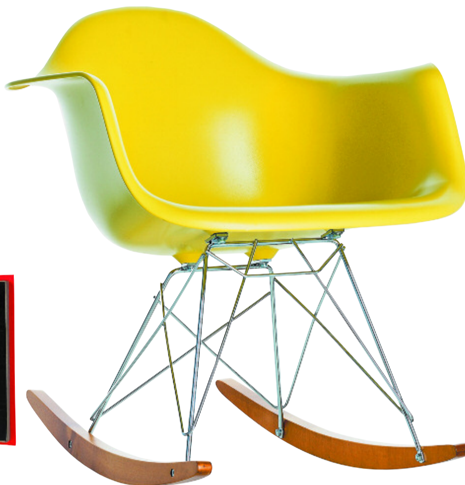
Mecedora de diseño. Silla Rar, diseñada por Ray & Charles Eames. Está disponible en varios colores: rojo, blanco, amarillo... 350 euros. De Vitra. www.vitra.com .