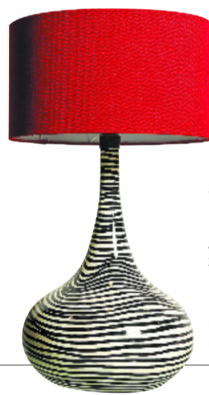
Safari. Lámpara con pantalla roja y pie con ilustración de cebra. 313 euros. De Las Rozas Village. www.las-rozasvillage.com .