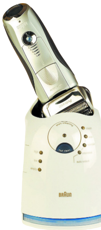
Ultrasónico. Lo hace todo: limpia, lubrica, seca y carga la máquina de afeitar. Tiene 10.000 micropulsaciones por segundo. 350 euros. De Braun. 917 22 21 79.