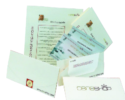
Compartir. Bono para una cena en restaurantes como La Broche o El Chaflán. El precio depende del número de comensales y del menú. De CenaSHOP. www.cenashop.com .