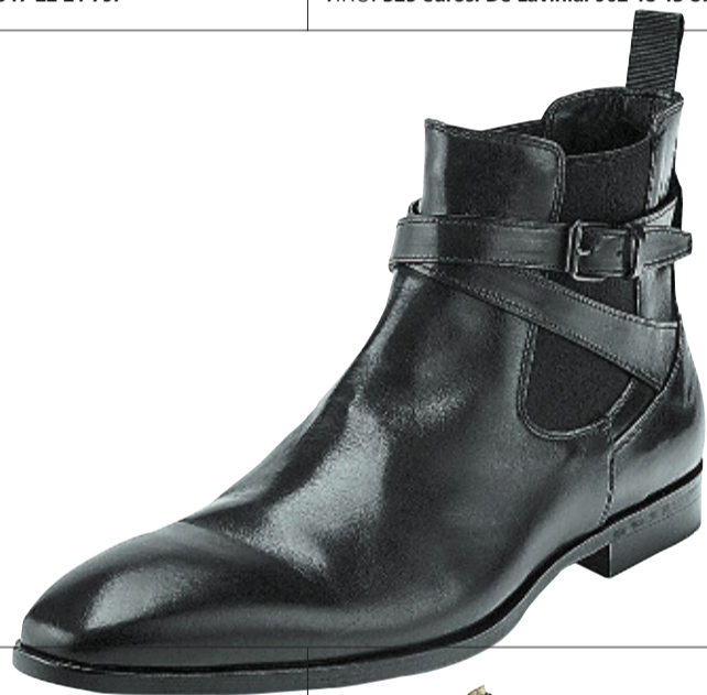
Para dandis. Botín en cuero negro con elástico y hebilla cruzada. 265 euros. De Boss Black. 913 60 10 00.