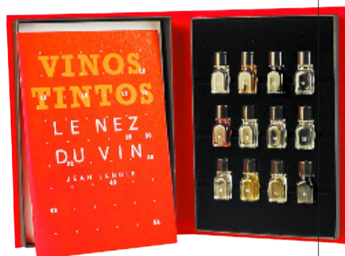
Sumiller. La Nariz del Vino. Así se llama este juego de 54 aromas para ejercitar la memoria olfativa en todo lo referente al vino. 325 euros. De Lavinia. 902 18 13 87.