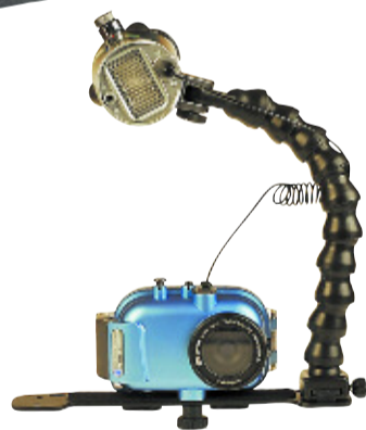
Acuática. Cámara de fotos digital con carcasa y flash incorporado. También fotografía en el exterior. 400 euros. De Casco Antigo. 911 51 02 50. www.cascoantigo.com .