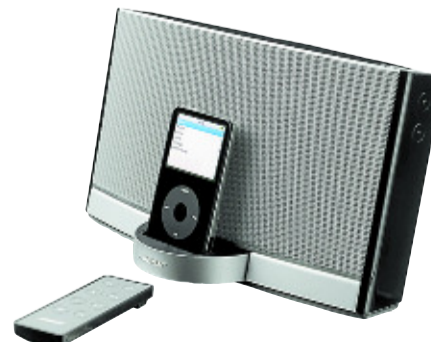
Alto y claro. SoundDock es un sistema de altavoces para el iPod que combina un sonido de alta calidad y portabilidad. 399 euros. De Bose. www.bose.maygap.com .