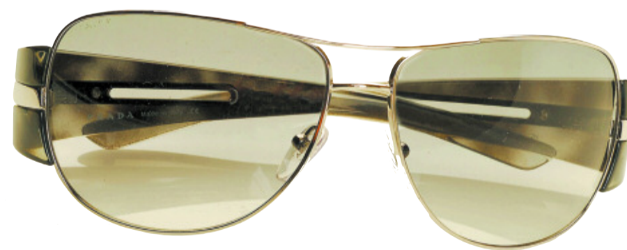
Miradas a la última. Gafas de Prada con cristal en forma de gota y montura de metal. 259 euros. De Luxottica. 934 79 19 89. www.luxottica.com .