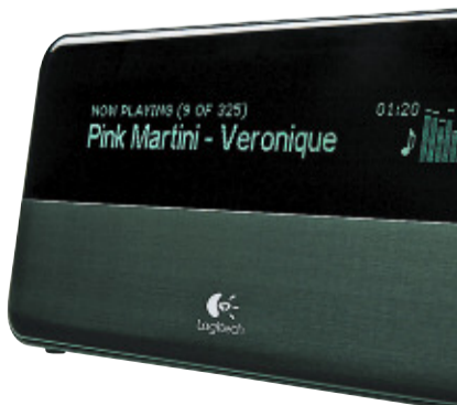
Música libre. Sistema inalámbrico que permite escuchar la música almacenada en un servidor desde cualquier parte del mundo. 299 euros. De Logitech. 913 75 33 68.